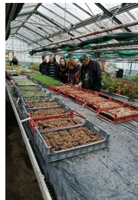
Balade urbaine Découverte de l'AIRA au CESAME