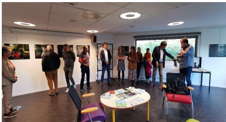
Expo photos d'Arnaud Roiné « Soigner, c'est être là » Médiathèque St Exupéry Les Ponts de Cé

Avec 17 actions d'informations sur les pôles ANGERS et CHOLET, notre délégation 49 a été une des plus actives sur le plan national pour conduire ces actions de déstigmatisation sur la santé mentale. Bravo à toutes et tous et Merci.