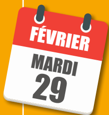
TABLE RONDE ET ATELIER À LA CHARTREUSE

Le 5 e forum des ESAT aura lieu jeudi 23 février, de 10h00 à 16h00, au Conseil Départemental, 1 rue Joseph Tissot à Dijon. Avec, à 14h00, une table ronde sur le parcours professionnel en ESAT, évolutions et perspectives . Entrée libre mais confirmer votre présence à l'adresse mdph@cotedor.fr