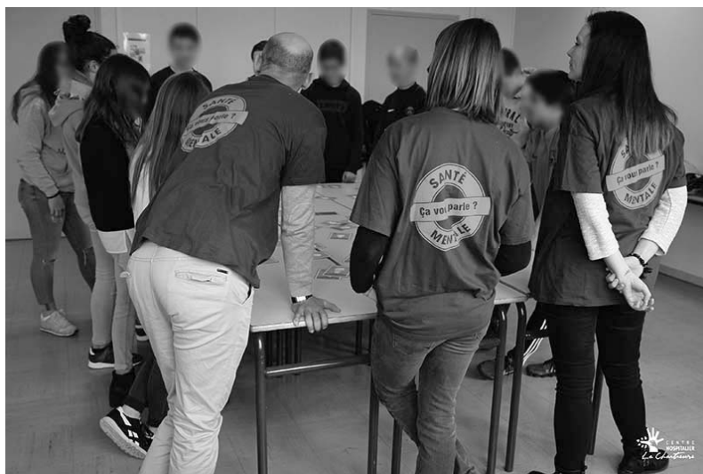
intervention au collège à Genlis