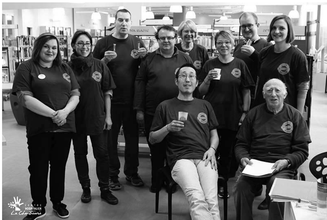
les animateurs de la bibliothèque vivante

Une nouvelle édition de la bibliothèque vivante s'est déroulée à la bibliothèque de Fontaine d'Ouche le samedi 24 mars 2018. La bibliothèque vivante fonctionne sur le modèle d'une bibliothèque classique, avec ses bibliothécaires, son catalogue de livres, son règlement, son décor chaleureux et accueillant favorisant la culture et la rencontre. L'objectif : faire tomber les préjugés et idées reçues en santé mentale par la rencontre.