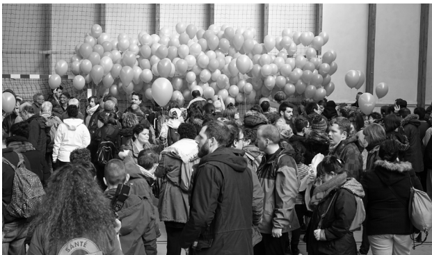
avant le départ

Cet événement était proposé, dans le cadre des SISM 2018 par l' UNAFAM en partenariat avec le Club Alpin Français Dijon , le Centre Hospitalier La Chartreuse, le Conseil Local de Santé Mentale ( CLSM ) Franco Basaglia, le Centre de Ressources Maladie et Handicap Psychiques ( CReMHPSy ), l'Agence Régionale de Santé Bourgogne Franche-Comté ( ARS BFC ), Harmonie Mutuelle , la MGEN et les PEP Bourgogne Franche-Comté.