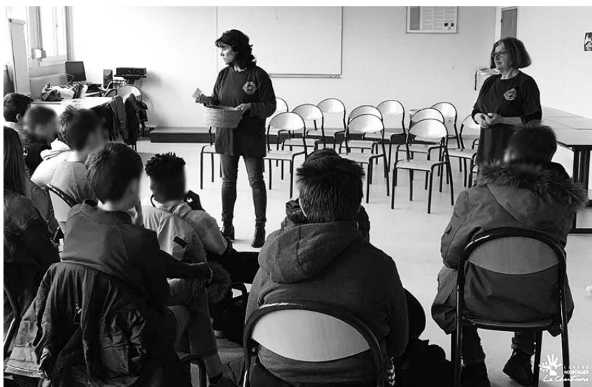
intervention au collège du Parc à dijon

La Direction, les professeurs, les assistantes sociales des deux établissements ont tous apprécié et sont partants pour l'an prochain. Des professeurs ont pu repérer des jeunes en souffrance.