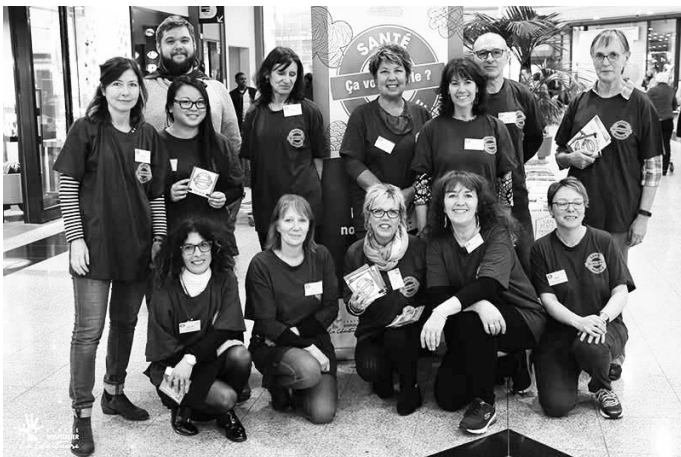
le psy tour au centre commercial de Quetigny