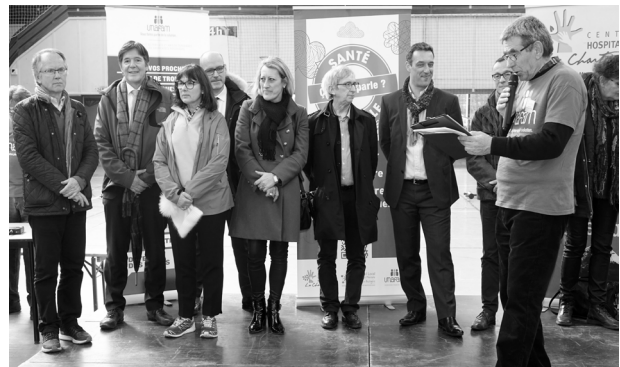
représentants des organismes organisateurs

Quelle aventure et quelle émotion de nous retrouver avec un public aussi varié provenant de différents centres de soins psychiatriques de la