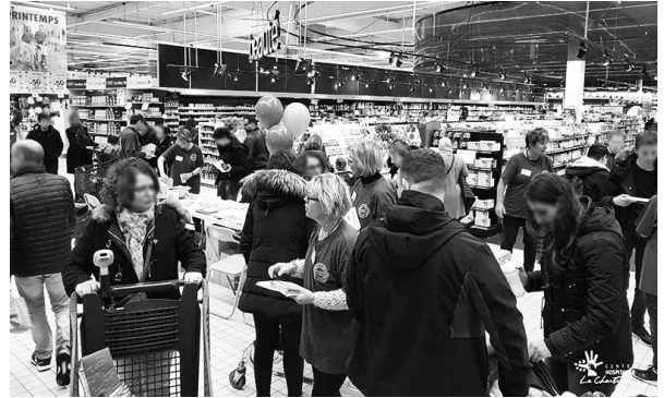
le psy tour au centre commercial de la Toison d'Or à Dijon

Une équipe pluri-professionnelle d'experts : médecins, infirmiers, association de familles et proches... s'est déplacée à la rencontre de la population dans des centres commerciaux, à Quetigny et à la Toison d'Or. A l'aide d'outils ludiques (Quizz...) et conviviaux (cafés, goodies...) ils ont échangé avec la population autour des idées reçues en santé mentale. Environ 200 personnes ont été touchées.