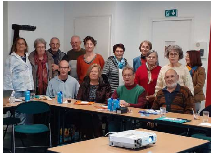
Les participants à la Journée d'information sur les troubles psychiques.

La délégation Unafam 79 remercie vivement Evelyne, bénévole animatrice et Michèle, psychologue, pour leur implication dans cette journée d'information pour la 2ème édition 2023, ainsi que les 14 participants pour leur écoute et leur bienveillance dans des échanges constructifs.