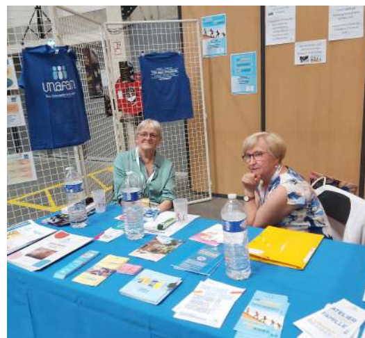
Deux de nos bénévoles de Bressuire, prêtes pour le Forum !

Également, tant de familles ici, ont pu apprécier son écoute, son aide bienveillante !