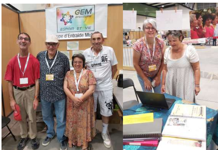
Les images du Forum associatif de Bressuire, où l'Unafam était bien entourée !

Ce fut également l'occasion de parler de l'UNAFAM.