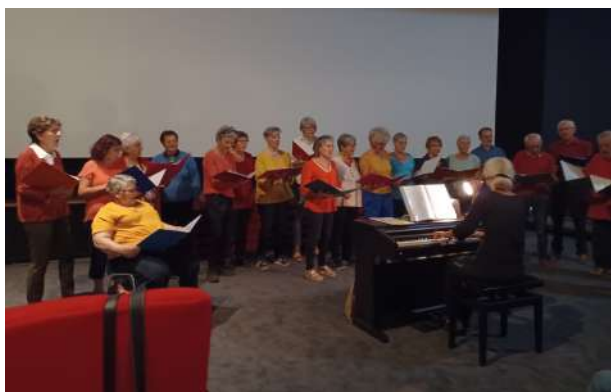
La chorale "L'Egaye" a proposé une petite représentation au cours de la soirée.

En Deux-Sèvres, plusieurs temps forts ont été organisés par l'Unafam ou en partenariat avec elle, comme les ciné-débats à Melle et Parthenay (lire notre article), sans oublier la deuxième édition d'"En voiture Psymone ! Le petit bolide de sensibilisation à la santé mentale".