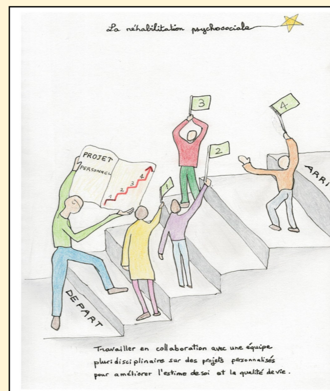
Dessin de Claudie Baykov. Bénévole Unafam 04