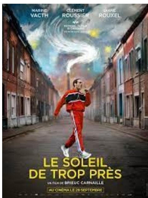
Affiche du film sorti le 28 septembre 2022

« À sa sortie d'hôpital psychiatrique, Basile se réfugie chez sa sœur Sarah. Elle est sa seule famille et sa plus grande alliée pour se reconstruire. Aussi flamboyant qu'instable, Basile parvient à trouver du travail et rencontre Élodie, une jeune mère célibataire : il se prend à rêver d'une vie « normale » ».