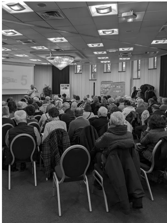
Assemblée Générale de l'UNAFAM – Juin 2023

Ce travail a été réalisé avec l'accompagnement du cabinet externe CO Conseil, qui a également travaillé à l'évaluation du projet associatif. En nous appuyant sur le projet associatif existant, nous avons ensemble décliné l'ambition, les objectifs, les axes et actions à mettre en œuvre dans les prochaines années pour rendre effectives les valeurs et missions portées par l'UNAFAM.