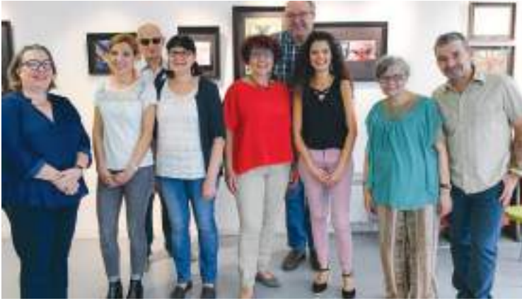
Remise des prix art postal