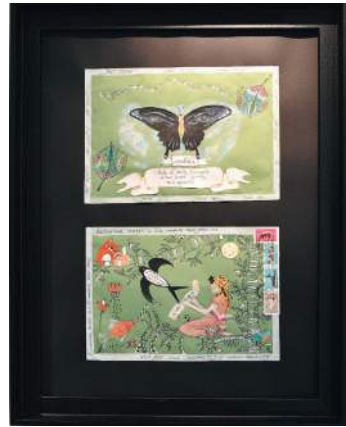
2 e prix : Annunzia di Palma de Grenoble (Isère)