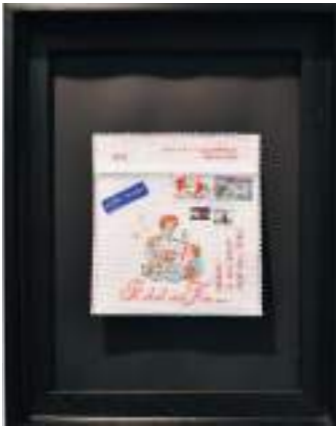
1 er prix : Renée Couture de Saint-Georges de Beauce Québec (Canada)