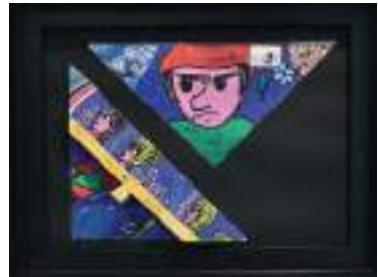
Emilie Vuez, 14 ans, de Foncine-le-Haut (Jura)