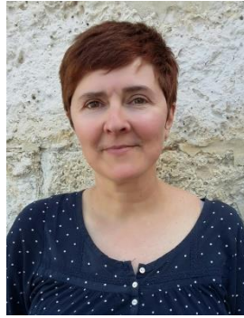
Notre nouvelle chargée de mission