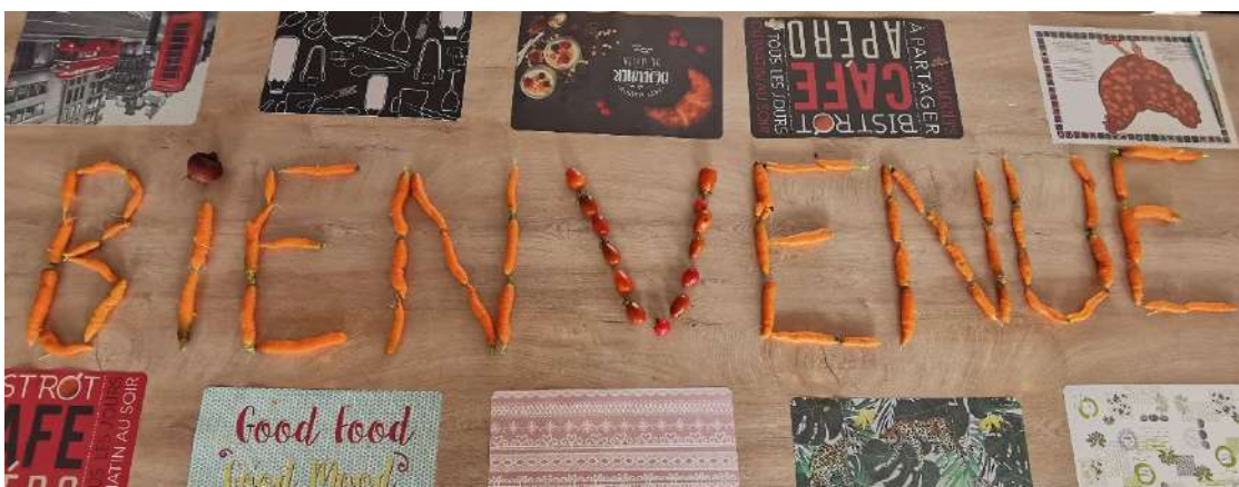
Bienvenue à la Résidence Accueil

La Résidence Accueil La Bazonnaire de Saint-Pardoux-Soutiers a ouvert ses portes en octobre 2020. Elle accueille des personnes en situation de précarités, grande vulnérabilités notamment dû à leurs fragilités psychiques pour qui la stabilité d'un logement accompagné leur permet de retrouver un rythme dans leur quotidien et de la convivialité.