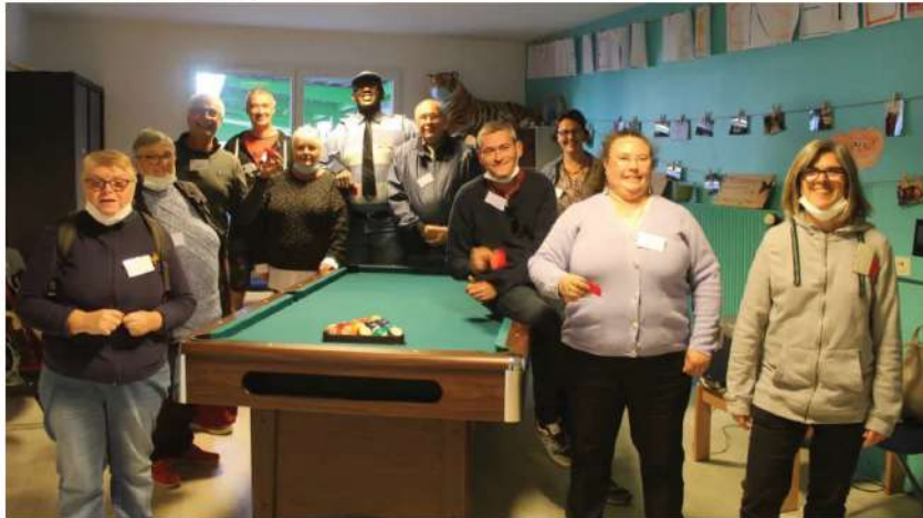
Le Groupe d'entraide mutuelle a inauguré ses locaux rue Ernest-Pérochon.

Publié le 15/10/2021 à 06:25 | Mis à jour le 15/10/2021 à 06:25