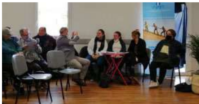
Trois personnes travaillant à l'Esat de Transition Messidor de Chauray ont raconté leur parcours.