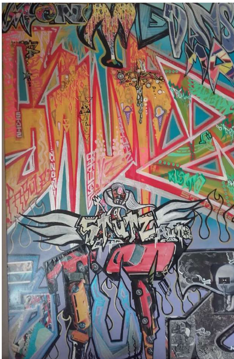
Illustration © VZ

Unafam Deux-Sèvres Centre hospitalier 40 avenue Charles de Gaulle 79000 Niort Mail : 79@unafam.org Tel : 05 49 78 27 35