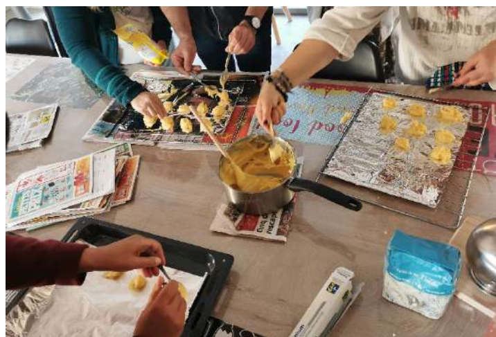
Atelier cuisine