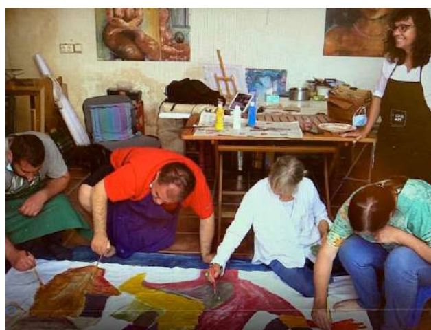
Les GEMeurs en pleine création de la fresque.

Se nourrir de l'art, de la peinture, de la musique, de la danse, nous donne la possibilité de rêver, de retrouver de l'espoir, d'avoir une vision plus positive de l'avenir. Avec notre fresque nous avons voulu montrer qu'ensemble nous sommes plus forts, nos corps entrelacés représentent que nous sommes un seul, que nous avons tous besoin des autres : une interdépendance nécessaire, vitale.