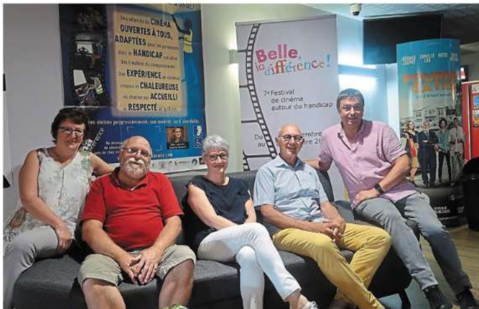
Bressuire, hier. Le festival « Belle, la différence » est bien lancé.