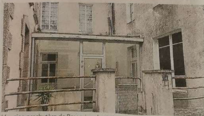
L'ancien presbytère de Bressuire, destiné à un habitat inclusif intergénérationnel.