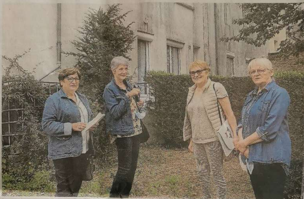
Bressuire, vendredi 17 septembre. Des membres de l'Unafam Nord 79 dans la cour de l'ex-presbytère où est prévu le projet immobilier.