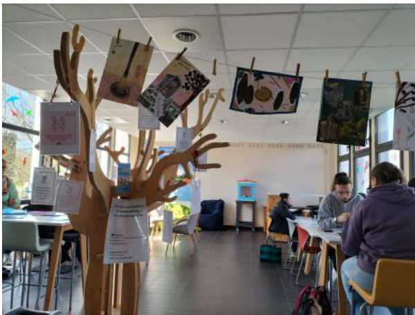
L'arbre aux idées reçues exposé dans les locaux du Pôle Universitaire Niortais.

Suite à de nombreux échanges ce jour-là par le biais du questionnaire déjà utilisé lors du passage de Pymone en octobre dernier, nous avons diffusé des informations sur le repérage des troubles, l'importance d'aller vers les personnes fragiles ou en difficulté et faire connaître les missions de l'Unafam destinées à rompre l'isolement.