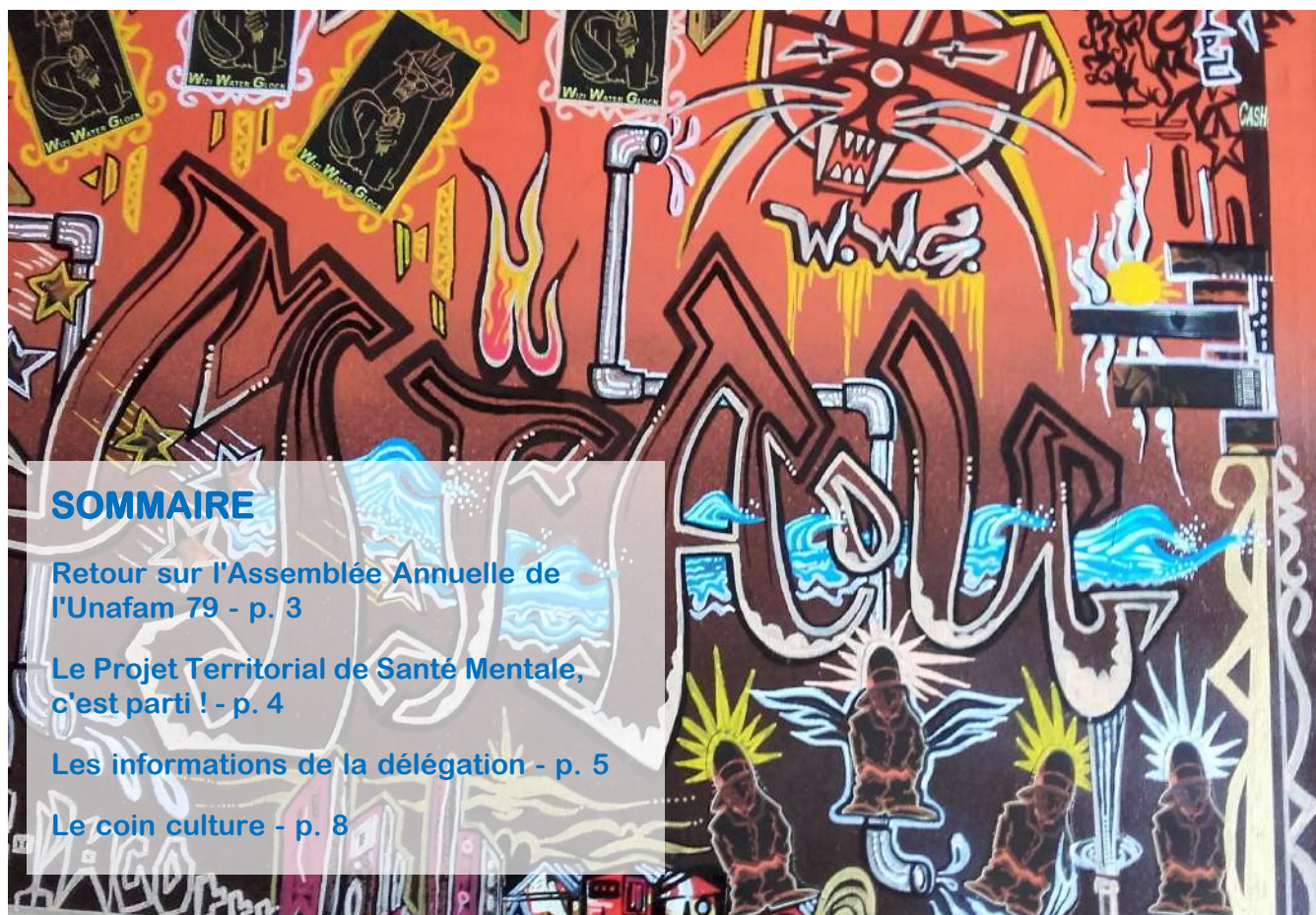
Illustration : VZ