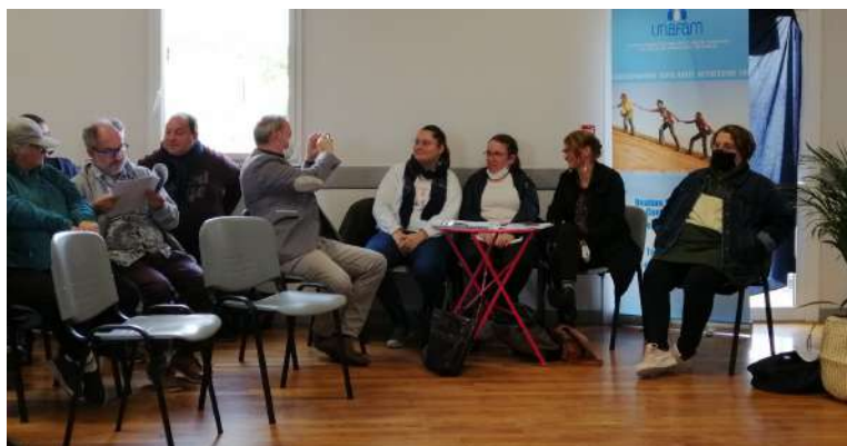
Trois personnes travaillant à l'Esat de Transition Messidor de Chauray ont raconté leur parcours.