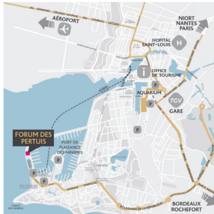
Forum des Pertuis - Avenue du Lazaret - 17000 La Rochelle