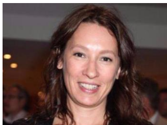
Emmanuelle BERCOT, Marraine du festival

Avec 40 partenaires oeuvrant dans le secteur médico social, le marrainage d'Emmanuelle Bercot, et le concert de Zebda, l'association Rénovation fête ses 60 ans à son image : généreuse, militante, tolérante. Conférence, débat, village associatif, concerts, forum des métiers... « Un R festif » est pensé pour réunir publics et professionnels et ouvrir le dialogue et l'accès à l'information sur le monde sanitaire et social. Avec en ligne de mire la déstigmatisation des personnes fragiles.