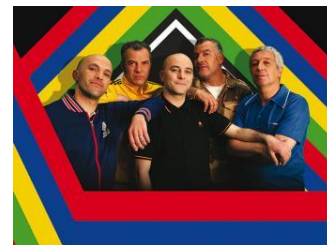
ZEBDA, Chanson française